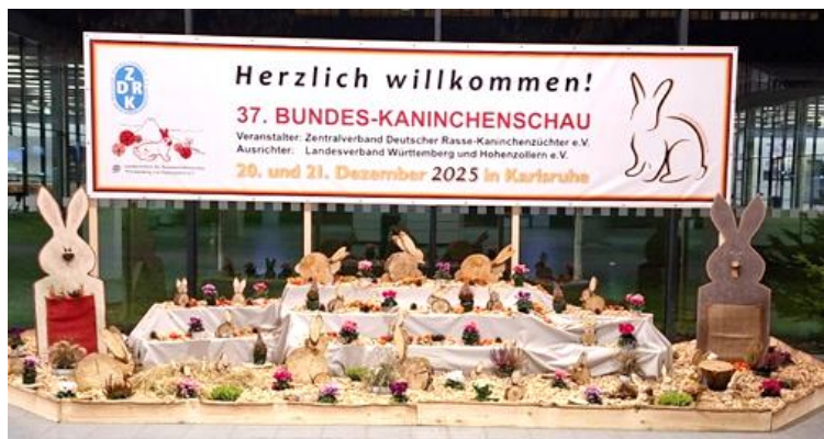
Willkommensbanner bei der 37. Bundes-Kaninchenschau am 20./21. Dezember 2025 in der Messe Karlsruhe.

Die 37. Bundes-Kaninchenschau 2025 in der Messe Karlsruhe wurde mit 19.061 Kaninchen besichtigt, davon 361 Kaninchen von unserer Jugend. Es wurden 18 Deutsche Jugendmeister, 6 Deutsche Vize-Jugendmeister und 14 Bundessieger errungen.