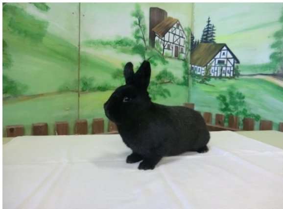
Beste 1,0 der Schau von Steffen Sauter Kls schwarz mit 97,5 Pkt.

ZGM Zink mit Helle Großsilber 384,5 Pkt. Bernd Schnepf mit Klein-Silber hell 384 Pkt.