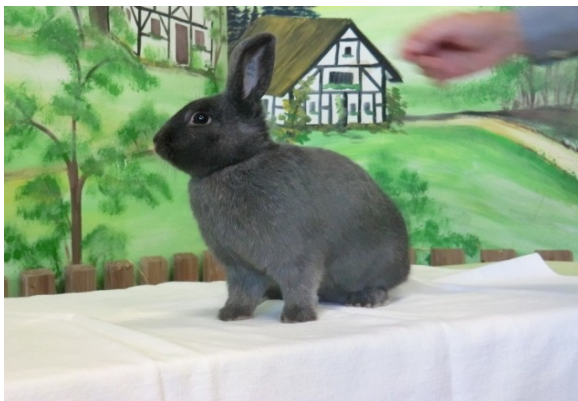
Beste 0,1 der Schau von Bernd Florus Kls blau mit 97,5 Pkt.