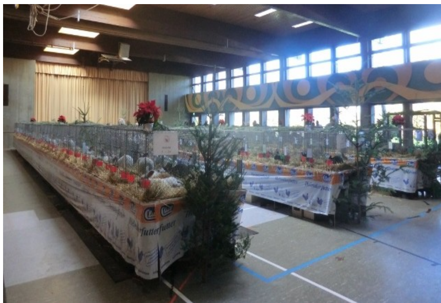
großzügige helle Auenwaldhalle