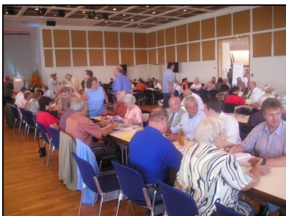
Auch Fachgespräche kamen nicht zu kurz

Europaschau führt uns nach Nitra in der Slowakei, wo die deutschen Züchter mehr als willkommen sein werden. In diesem Zusammenhang vermeldete Präsident Mickmann, dass die ausgestellten Tiere der deutschen Züchter keine Edding-geschwärzten Ohren haben müssen, sondern dass deren Tiere auch - wie bei uns auf den Schauen gewohnt - zur Ausstellung angenommen werden. Apropos Europaschauen: Unter der Hand, aber doch relativ offiziell verlautete, dass die Europaschau 2012 in Nürnberg über die Bühne geht. Ganz sicher bin ich, dass Nürnberg – wie auch die Europaschau in Leipzig – mit einem tollen Ausstellungsergebnis wird aufwarten können.