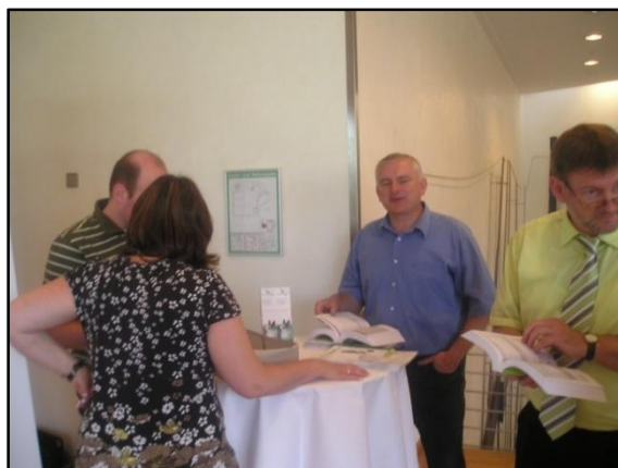
Neben den LV-Deligierten konnten auch viele Gäste begrüßt werden.

Begehrnt ist auch die Ausrichtung der Bundes-Rammlerschauen: Der LV Hannover richtet im Januar 2017 diese Schau in den Messehallen in Hannover aus.