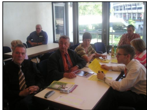
Unser Landesverband war bestens vertreten

Die Fachtagungen der Ressorts „Schulung“ und „HuK-Gruppen“, die Sitzung der ZDRK-Standard-Kommission, sowie die Präsidiums- und die Erweiterte Präsidiumssitzung, sowie die sonntägliche JHV des Verbandes bildeten die Eckpunkte konzentrierter und richtungsweisender Arbeit der Vertreter aller Landesverbände im ZDRK.