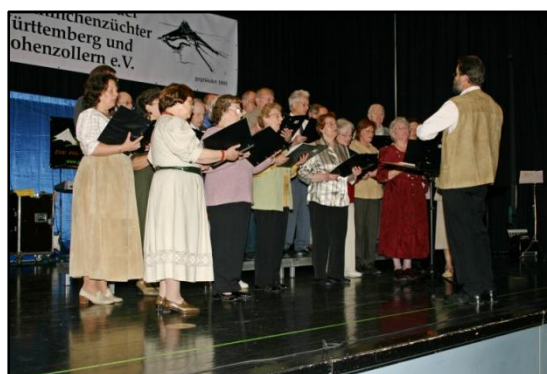
Musikalische Eröffnung des Festabends durch den Gesangsverein „Eintracht Friedrichstraße“

Der Festabend wurde moderiert durch den Gastgeber, 1. KVV Hörner, der eigens für diesen Anlass einen Liedtext über unser schönes Hobby verfasste. Mit Chorgesang, Alphorn-Darbietungen, Showtanz und zauberhaften Einlagen wurde zum gemütlichen Teil übergeleitet, der mit einer schwungvollen Tanz- und Schlagermusik-Darbietung seinen Abschluss fand.