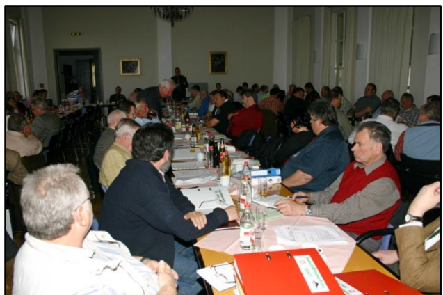
Blick in die Sitzung des Erweiterten Verbandsausschuss

Nach einer lebhaften und ganz im Zeichen der sonntäglichen Wahlen leidenschaftlich geführten Sitzung des Erweiterten Verbandsausschusses , stand ein sehr erfreuliches Ergebnis auf der Habenseite, über das sich unsere LV-Jugendabteilung freuen kann: Ab sofort finanziert der LV die benötigten Jugend-LVE aus Mitteln der Hauptkasse. Dieser Beschluss trägt in Zukunft wesentlich dazu bei, dass der finanzielle Handlungsspielraum unserer so wichtigen LV-Jugend-Abteilung vergrößert und erweitert wird.