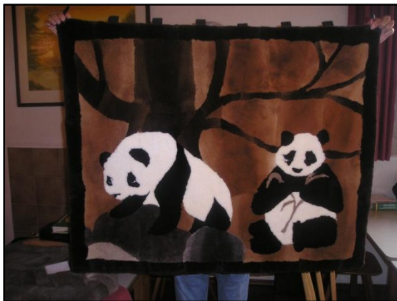
Vorstellung Werke der Handarbeits- und Kreativgruppen

Die Badischen Freunde des Rassekaninchenzüchterverbandes haben sich mächtig ins Zeug gelegt: Planung, Durchführung und GASTFREUNDSCHAFT: Vom Feinsten! 100 Jahre Kreisverband Pforzheim und 60 Jahre ZDRK – zwei Geburtstage im Doppelpack! So war der würdige Rahmen für die diesjährige Haupttagung des Zentralverbandes Deutscher Rassekaninchenzüchter in der Gold- und Schmuckstadt Pforzheim, die traditionell im Juni abgehalten wird, abgesteckt. Ein großes Familienfest der organisierten Rassekaninchenzucht konnte gefeiert werden inmitten arbeitsreicher Tage und entspannter mediterraner anmutender Nächte. Der EM-Fußball zaubert dieses Flair auf die Straßen Pforzheims und inmitten der Autokorsos unserer türkischstämmigen Landsleute und den Fans unserer EM-Fußballfreunde nach dem grandiosen 3:2-Sieg über Portugals Elf fühlte man sich wie ein Stück im Urlaub. Schöne Erinnerungen, danke Pforzheim!